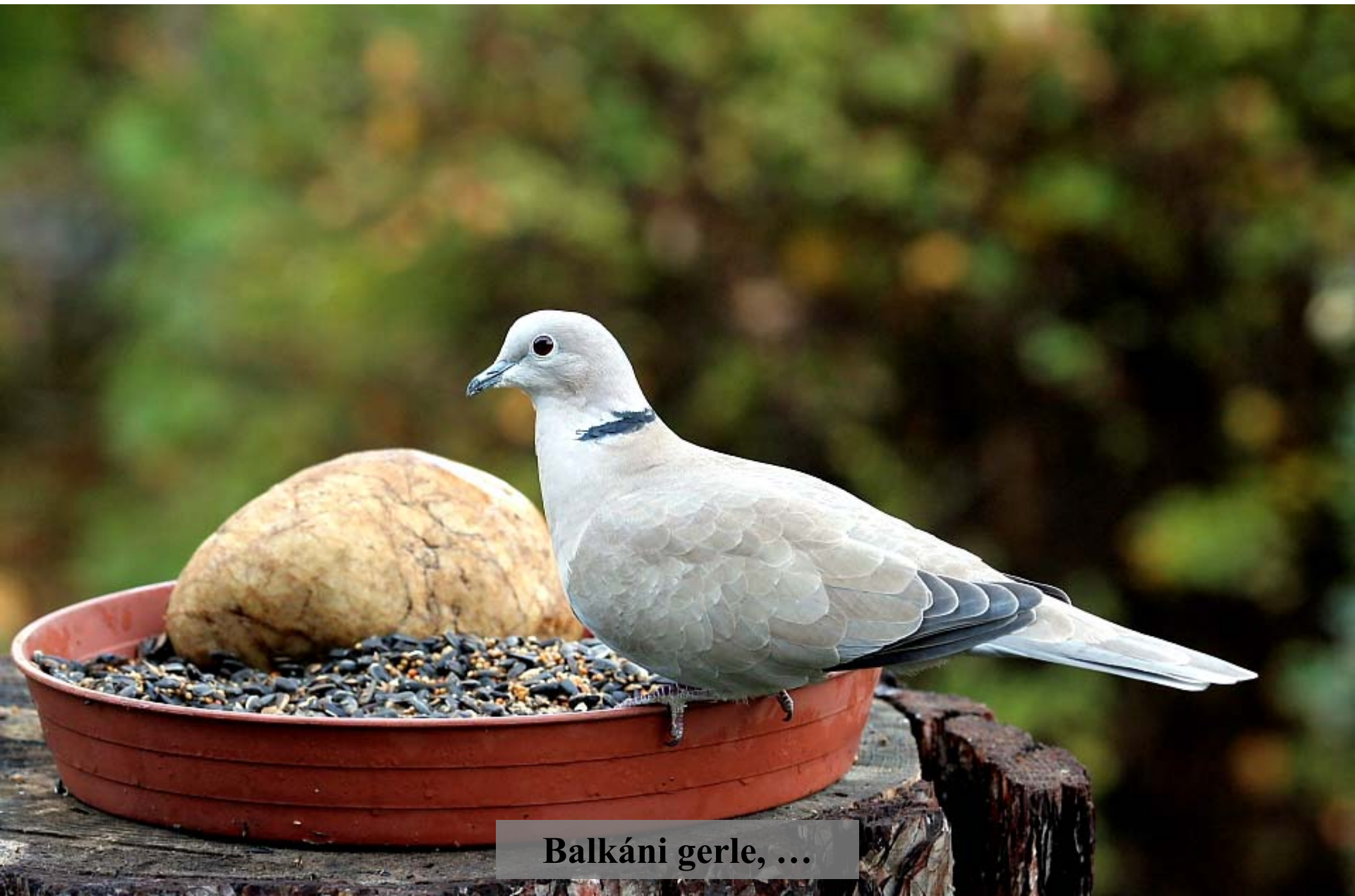
Balkáni gerle, ...