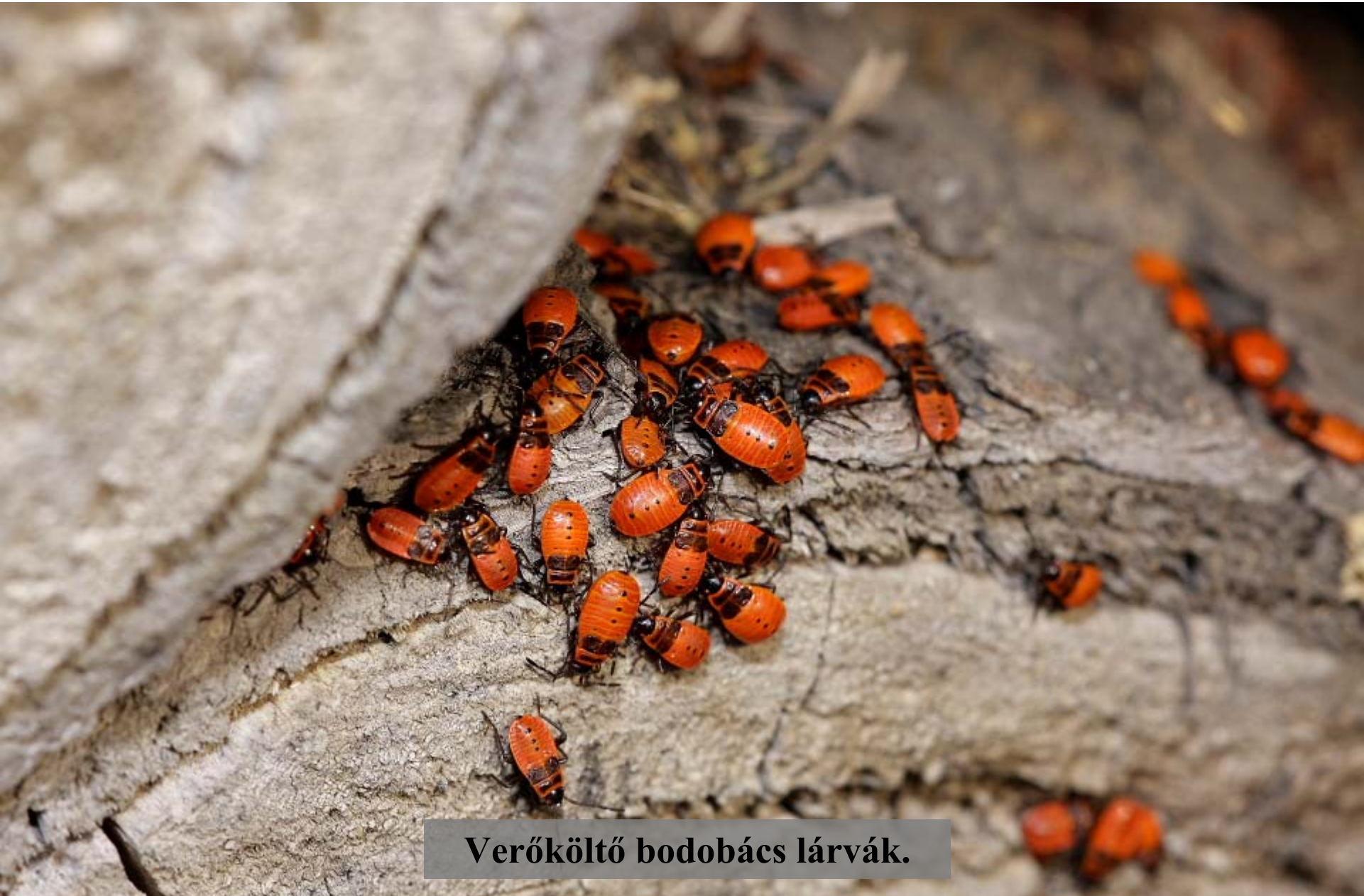
Veróköltő bodobács lárvák.