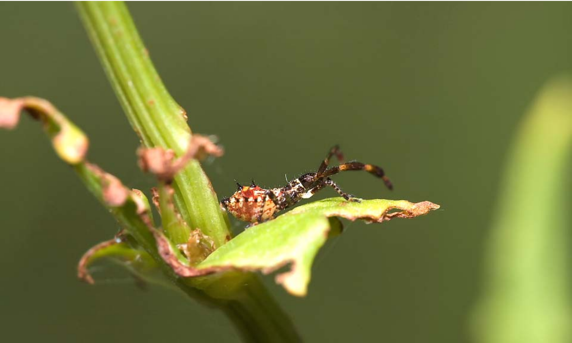
Közönséges karimás poloska lárvája.