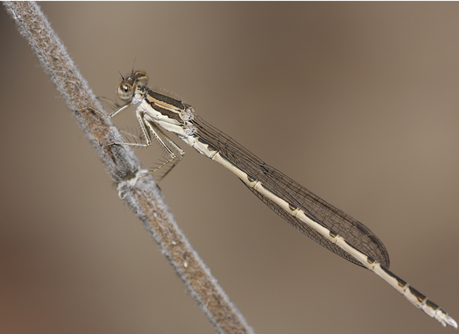
Erdei rabló (szitakötőfaj).