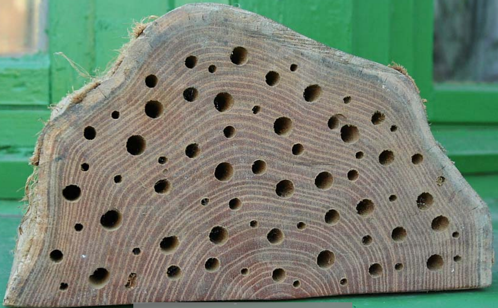
Egy kifurkált tűzifa kugli ...