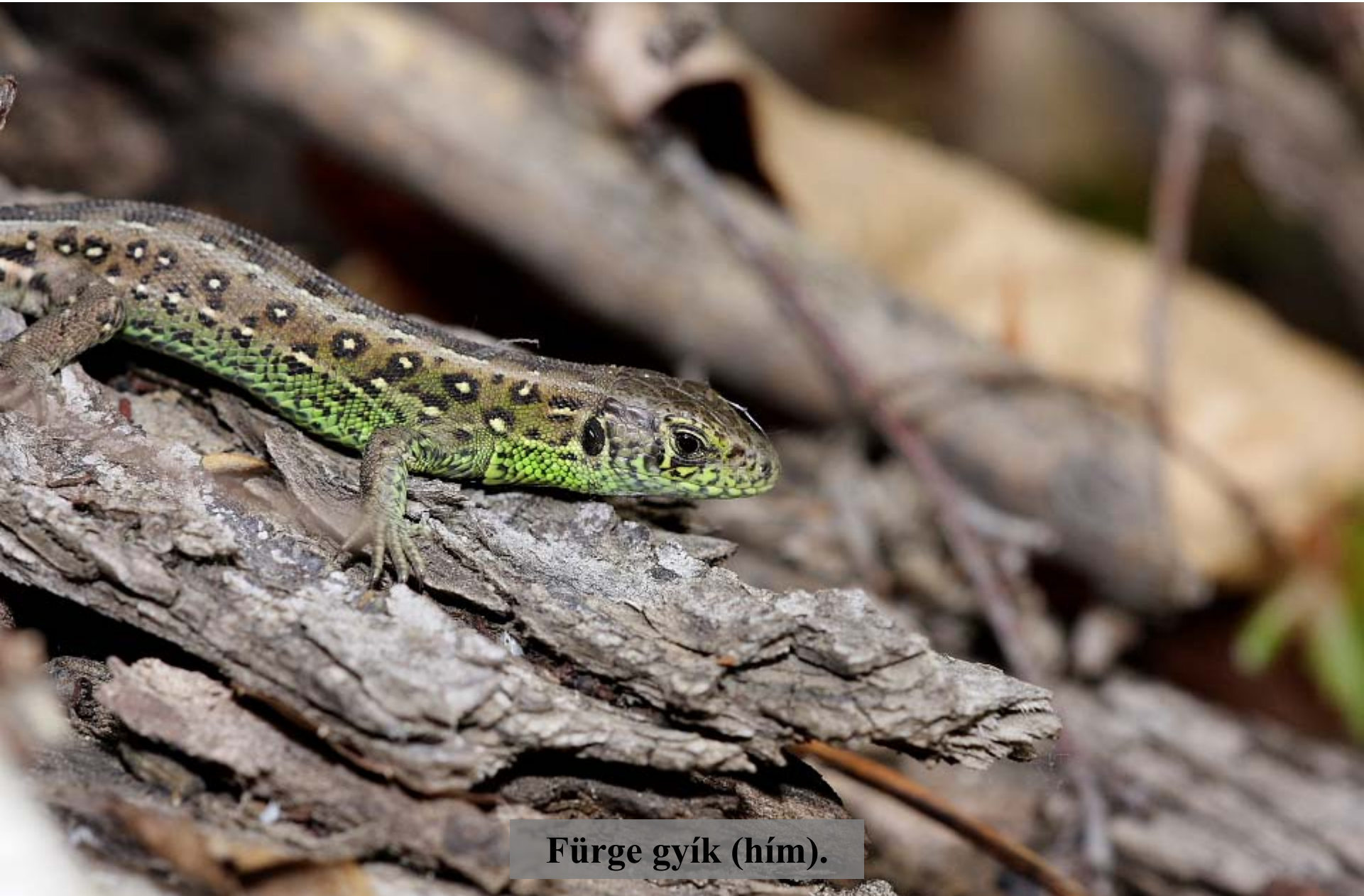
Fürge gyík (hím).