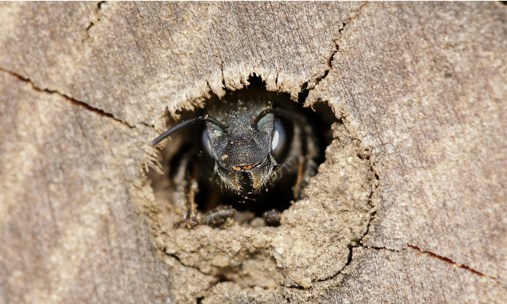
Darázsgarázsbeli üregének bejáratából kikukucskáló magányos méh faj.