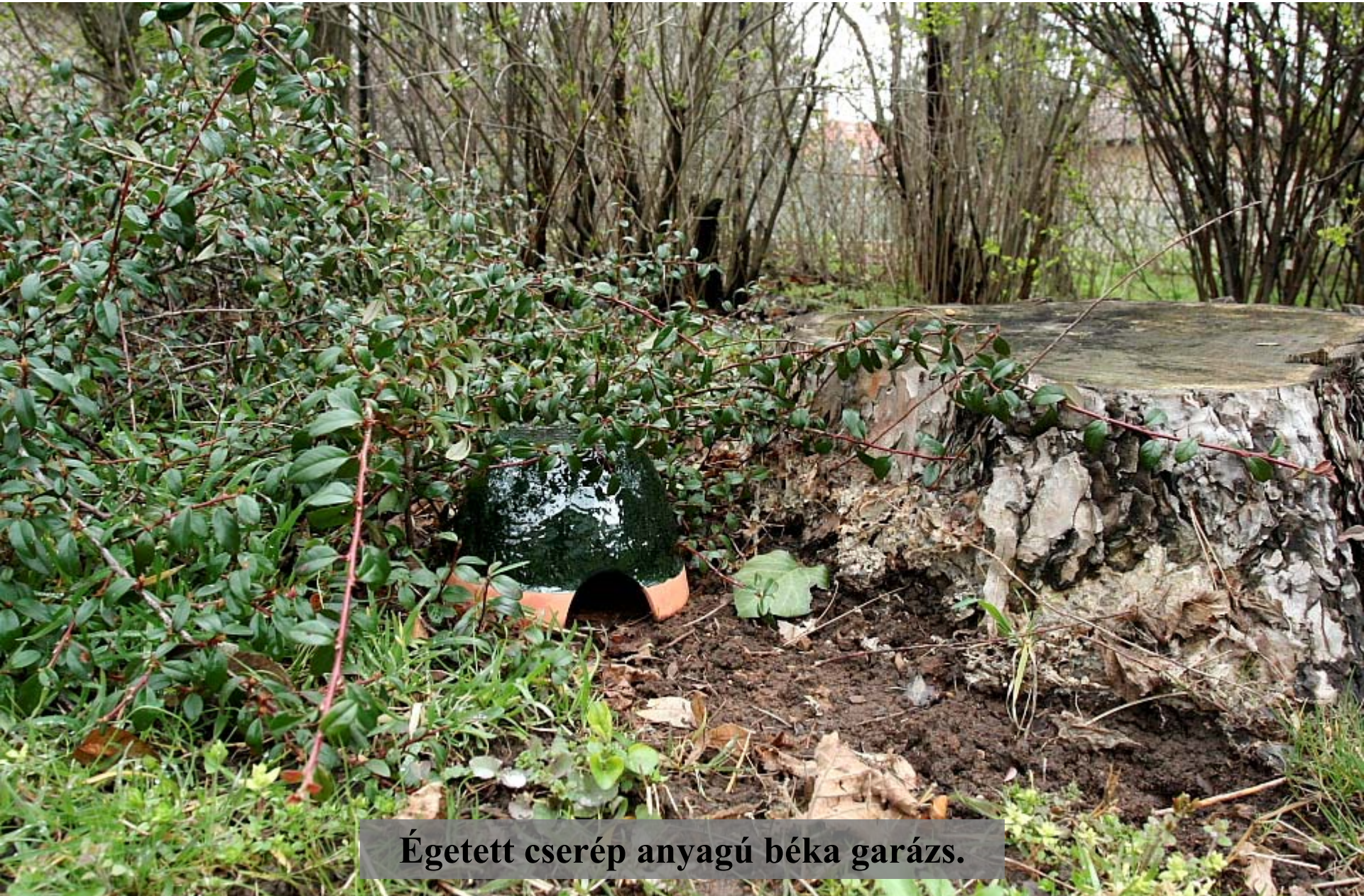
Égetett cserép anyagú béka garázs.