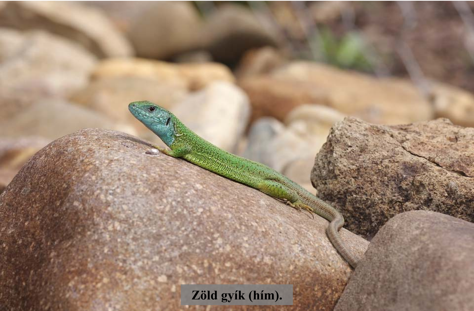
Zöld gyík (hím).