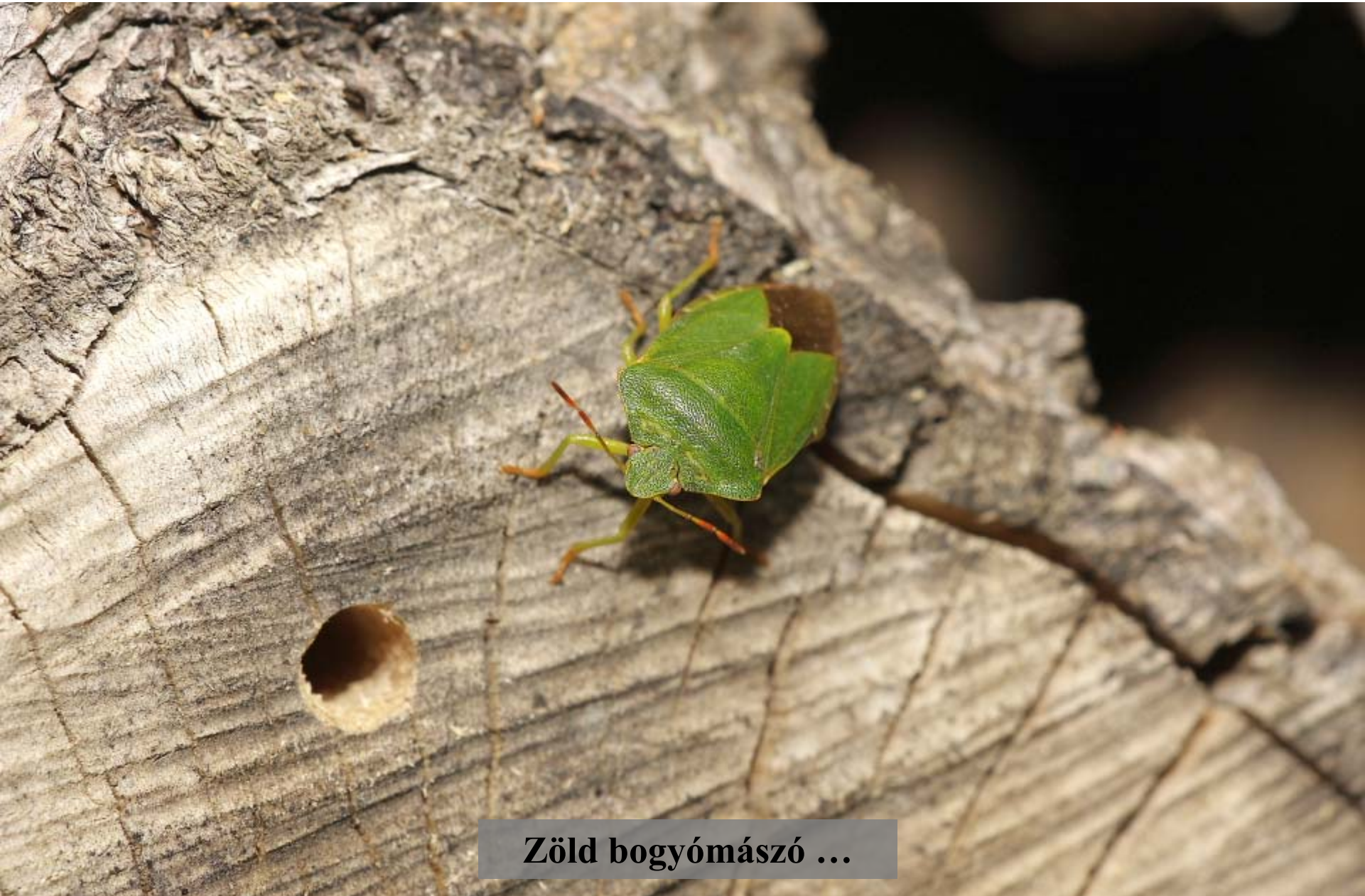
Zöld bogymászó ...